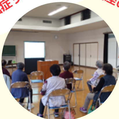
認知症サポーター養成講座の様子