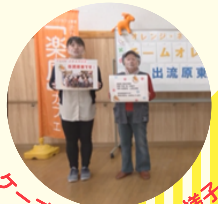
ケーブルTV 1分PRの様子