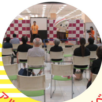
アルツハイマーデーイベント

佐野市には認知症地域支援推進員が2名います。地域包括支援センター佐野市民病院でも認知症に関する相談をお受けしておりますので、お気軽にご相談ください。