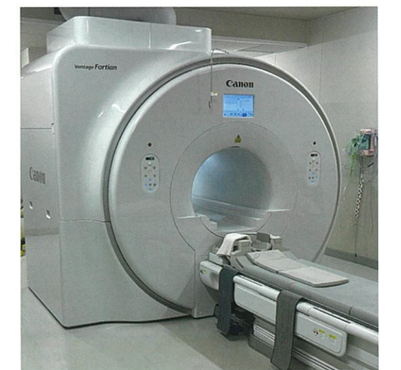
Canon製 MR ( Vantage Fortian )

80列ヘリカルCT装置は、低被ばく撮影、適量の造影剤 で高画質な検査を可能にし、また場合によっては少量の 造影剤での検査も可能です。さらに検査時間の短縮も実 現し、10年先を見据えています。