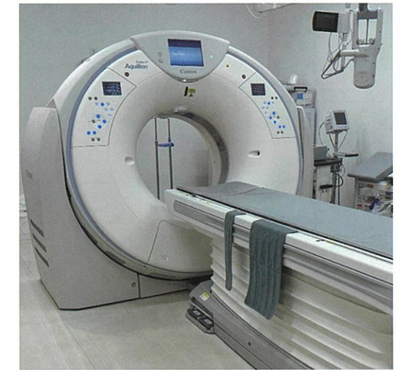
Canon製 CT ( Aquilion Prime SP )

現在、診断・治療は画像診断なくして成り立たない 時代になっています。できるだけ早期に病変が発見 でき、より多くのことが分かる画像を提供できるよう に新棟の開院にあわせ新しいCT装置とMR装置を 導入しました。院内には画像情報システム(PACS)も 構築されています。